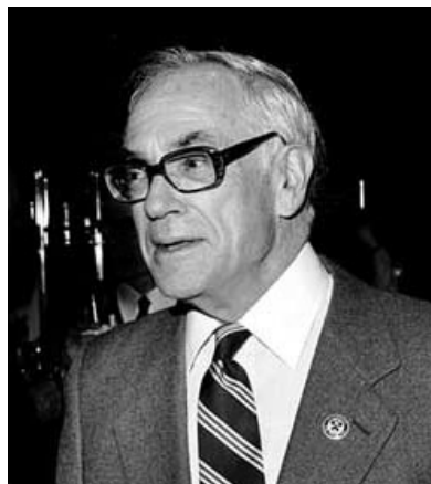
Malcolm Stevenson Forbes - (*19/08/1919 + 24/02 1990)

Malcolm Stevenson Forbes era publisher de Forbes Magazine , fundado por seu pai B.C. Forbes e hoje sob a direção do seu filho Steve Forbes. Graduado pela Escola de Lawrenceville e Universidade de Princeton.. Doou o dinheiro para Faculdade de Forbes , uma das seis faculdades residencial na universidade. Recebeu um grau honorary de Universidade de Miami em Oxford, Ohio e foi iniciado como um membro honorary do capítulo do alfa de Phi Kappa Tau.