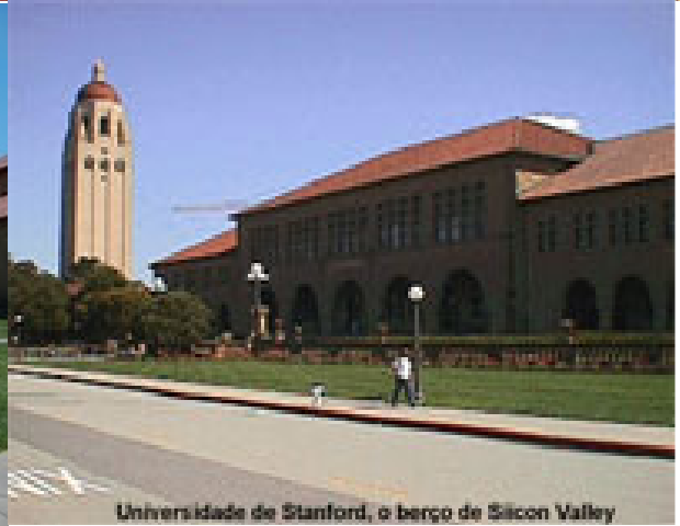
Universidade de Stanford